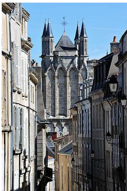
Rue de la cathédrale - Daniel Proux

Axe majeur de Poitiers, la rue de la cathédrale reliait les deux centres de la cité médiévale : le Palais des comtes de Poitou – ducs d’Aquitaine, siège du pouvoir temporel, et la cathédrale Saint-Pierre, siège du pouvoir spirituel. On y admire encore aujourd’hui de luxueuses demeures qui s’y élevèrent à l’époque moderne, comme l’hôtel Vétault (n°76) ou l’hôtel Barbarin de Jossé (n°32).