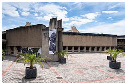
Musée Sainte-Croix

L'architecte poitevin Jean Monge inaugura en 1974 un projet audacieux typique du style brutaliste. D'aspect massif, le musée présente des formes résolument modernistes qui mettent en avant les particularités du béton armé laissé brut, qui ont justifié sa labélisation « Patrimoine du XXe siècle ».