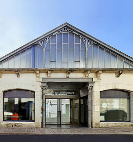
Maison de l'architecture