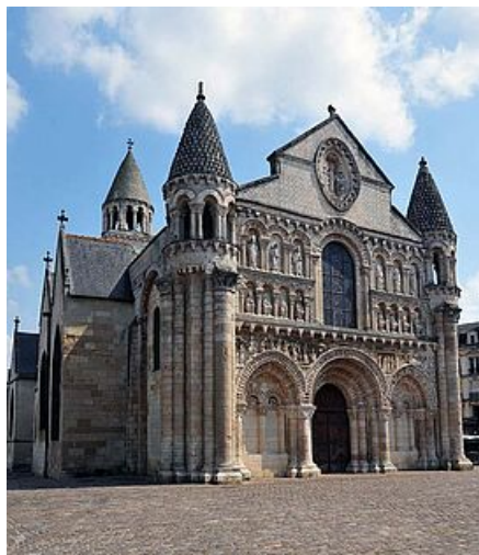
Eglise Notre-Dame-la-Grande

Rebâtie au XIe, Notre-Dame-la-Grande est l'un des joyaux de l'art roman. Reconnaisable notamment à son clocher à toit d'écailles, elle est surtout connue pour sa façade richement sculptée. Réalisée au début du XIIe siècle, c'est un chef d'œuvre de la sculpture romane qui mêle décor ornemental et message théologique. A l'intérieur, le décor date, pour l'essentiel, du XIXe siècle. Quelques vestiges de décors peints romans subsistent néanmoins dans le chœur.