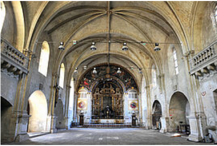
Chapelle Saint-Louis ©Ville de Poitiers © Ville de Poitiers

Autorisés à fonder à Poitiers un collège royal en 1604, les Jésuites y adjoignent une chapelle construite entre 1608 et 1614. Elle est l'un des bijoux de l'architecture classique de Poitiers avec sa façade à ordre colossal dorique. La chapelle reprend les grands principes de l'architecture de la Contre-Réforme avec sa large nef unique, cantonnée de chapelles et un transept peu saillant afin de faciliter la vue vers l'autel. Un retable monumental est réalisé en 1609 en pierre et marbre noir, doré et peint. La sacristie, adjointe à la chapelle en 1664, présente quant à elle un décor remarquable de boiseries sculptées.