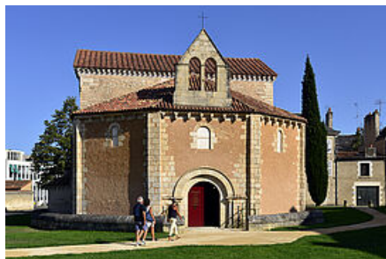
Baptistère Saint-Jean

Edifié au Ve siècle, le baptistère Saint-Jean est l'un des plus anciens monuments chrétiens de France, voire d'Europe. Son décor extérieur constitue un précieux et rare témoin de l'art mérovingien. Ayant subi plusieurs transformations architecturales entre les Ve et XIe siècles, il se distingue par son décor sculpté extérieur du VIIe siècle fait de pierre et de brique, et par la grande qualité de son décor intérieur peint des XIe et XIIIe siècles. Vendu comme bien national, il est sauvé de la destruction et racheté par l'Etat en 1834. Aujourd'hui, y est exposée une très belle collection de sarcophages mérovingiens.