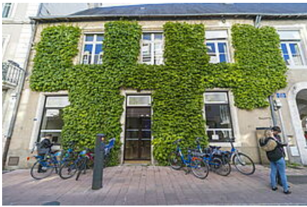
Atelier du Palais - Ville de Poitiers